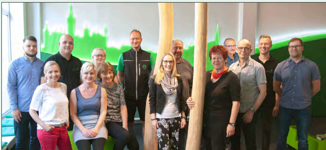
Im Mietercenter in der Geschwister-Scholl-Straße 4 betreuen die Mitarbeiter rund 2.300 Wohneinheiten sowie Gewerbeobjekte und Garagen für die Stadtteile Altstadt und Weststadt